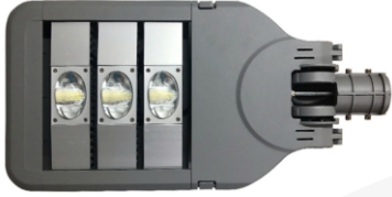
(Hình ảnh chỉ mang tính chất tham khảo)