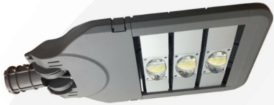
(Hình ảnh chỉ mang tính chất tham khảo)