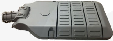
(Hình ảnh chỉ mang tính chất tham khảo)