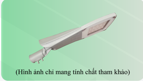
(Hình ảnh chỉ mang tính chất tham khảo)