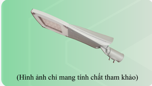
(Hình ảnh chỉ mang tính chất tham khảo)