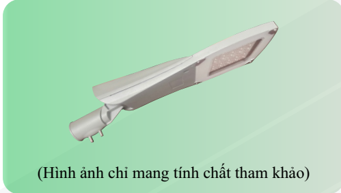
(Hình ảnh chỉ mang tính chất tham khảo)

Để đảm bảo tính thẩm mỹ, cân đối với trụ đèn và hài hòa với cảnh quan xung quanh đề nghị sử dụng đèn LED có kiểu dáng và kết cấu như sau: