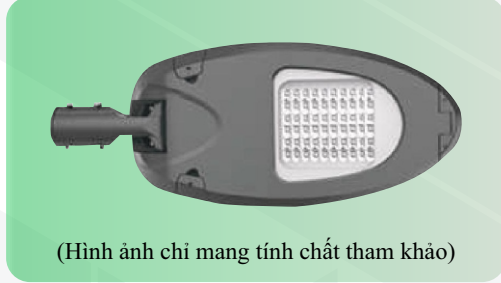
(Hình ảnh chỉ mang tính chất tham khảo)