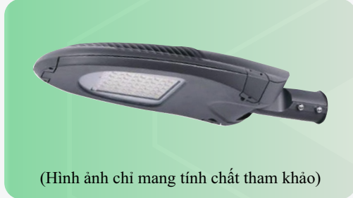
(Hình ảnh chỉ mang tính chất tham khảo)