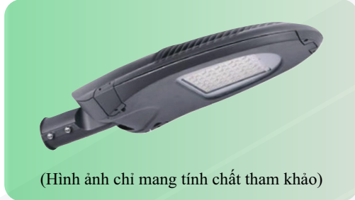
(Hình ảnh chỉ mang tính chất tham khảo)

Để đảm bảo tính thẩm mỹ, cân đối với trụ đèn và hài hòa với cảnh quan xung quanh đề nghị sử dụng đèn LED có kiểu dáng và kết cấu như sau: