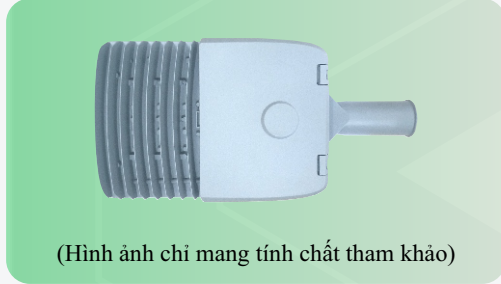
(Hình ảnh chỉ mang tính chất tham khảo)