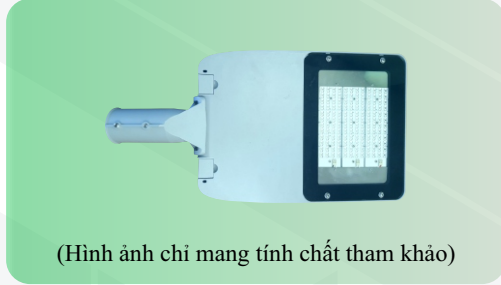
(Hình ảnh chỉ mang tính chất tham khảo)