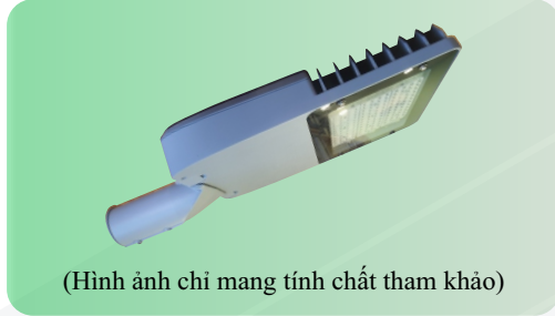
(Hình ảnh chỉ mang tính chất tham khảo)

Để đảm bảo tính thẩm mỹ, cân đối với trụ đèn và hài hòa với cảnh quan xung quanh đề nghị sử dụng đèn LED có kiểu dáng và kết cấu như sau: