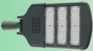
(Hình ảnh chỉ mang tính chất tham khảo)