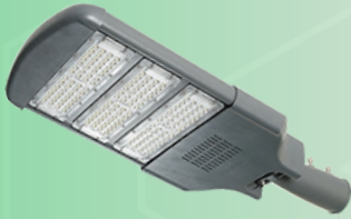
(Hình ảnh chỉ mang tính chất tham khảo)