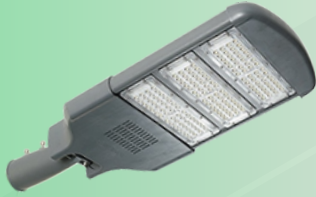
(Hình ảnh chỉ mang tính chất tham khảo)

Để đảm bảo tính thẩm mỹ, cân đối với trụ đèn và hài hòa với cảnh quan xung quanh đề nghị sử dụng đèn LED có kiểu dáng và kết cấu như sau: