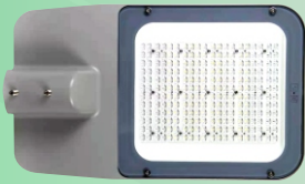
(Hình ảnh chỉ mang tính chất tham khảo)