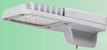
(Hình ảnh chỉ mang tính chất tham khảo)