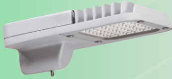
(Hình ảnh chỉ mang tính chất tham khảo)

Đảm bảo tính thẩm mỹ, cân đối với trụ đèn và hài hòa với cảnh quan xung quanh để nghị sử dụng đèn LED có kiểu dáng và kết cấu như sau: