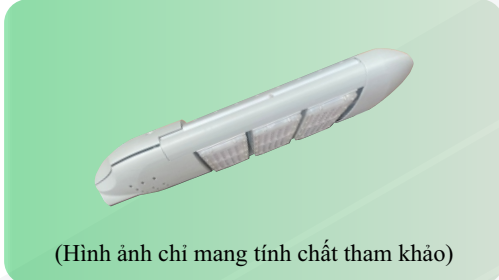
(Hình ảnh chỉ mang tính chất tham khảo)

Để đảm bảo tính thẩm mỹ, cân đối với trụ đèn và hài hòa với cảnh quan xung quanh đề nghị sử dụng đèn LED có kiểu dáng và kết cấu như sau: