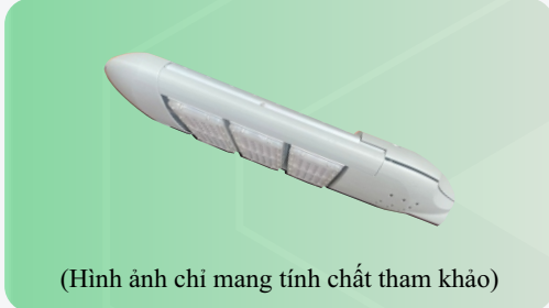
(Hình ảnh chỉ mang tính chất tham khảo)